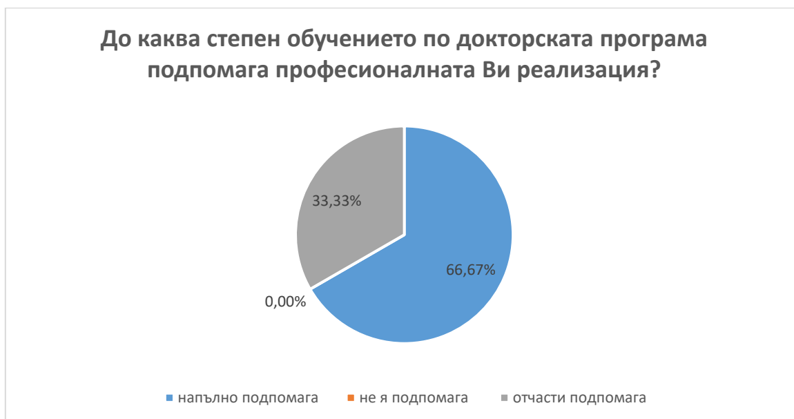
Фиг. 15 Принос на докторската програма за професионалната реализация

В13. 66,67 % от анкетираните докторанти са на мнение, че обучението по докторската програма напълно подпомага, 33.33 % отчасти подпомага професионалната им реализация. (фиг. 15)