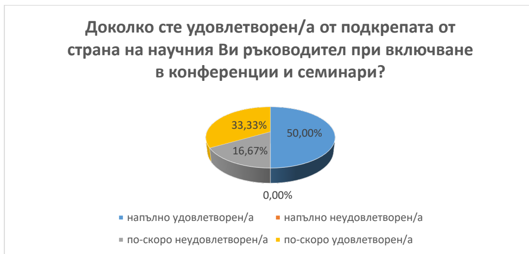
Фиг. 9. Удовлетвореност от подкрепа на научен ръководител при включване в конференции и семинари

В.8.3 Регистрираните данни показват, че 50 % от докторантите са напълно, а 33.33 % по-скоро удовлетворени от подкрепата на научния им ръководител при включване в конференции и семинари. А един от анкетираните докторанти е по-скоро неудовлетворен. (фиг. 9)