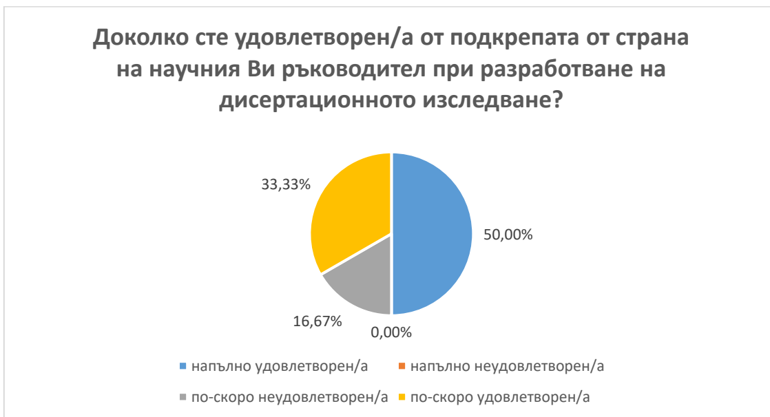
Фиг. 8. Удовлетвореност от подкрепа на научен ръководител при разработване на дисертационно изследване

че са по-скоро удовлетворени и един от докторантите посочва отговор, че е по-скоро неудовлетворен. (фиг. 8)