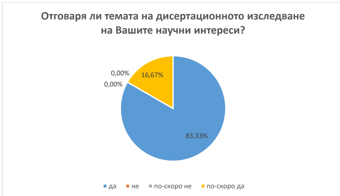
Фиг. 4. Съвпадение между научни интереси и темата на дисертационното изследване

В.6 50 % от анкетираните са на мнение, че обучението в съответната докторска програма по-скоро отговаря или напълно (33.3%) отговаря на очакванията им. 16.67 % от респондентите имат негативно мнение и дават отговор „не“. (фиг. 5)