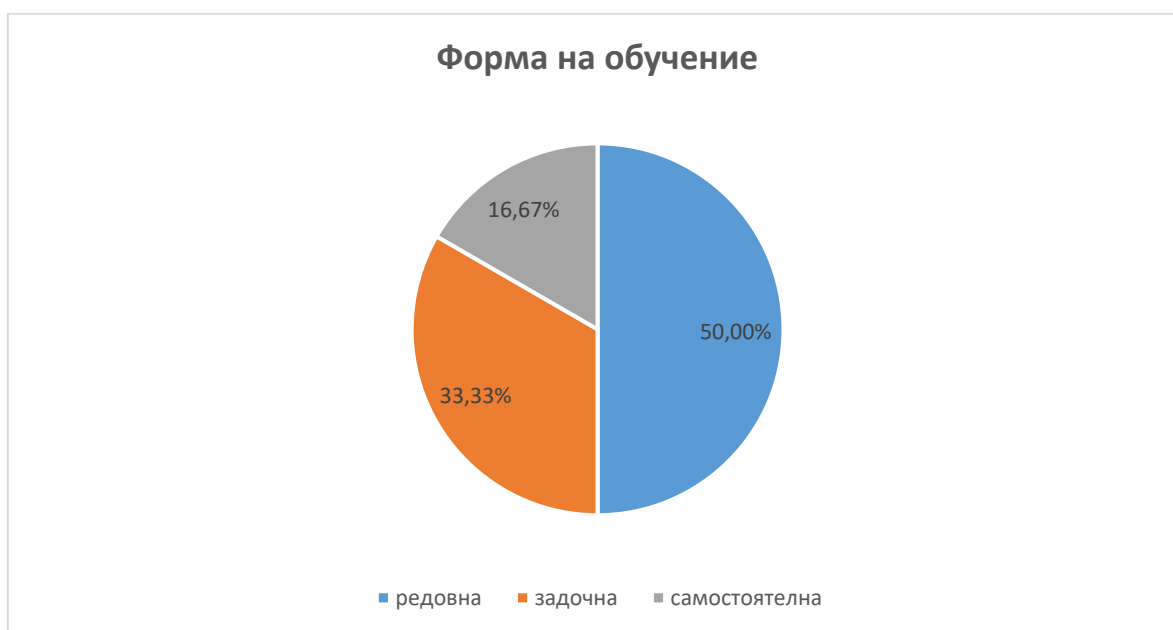
Фиг. 1. Разпределение на докторантите по форма на обучение

В зависимост от формата на обучение, анкетираниите са разпределени както следва (фиг. 1):