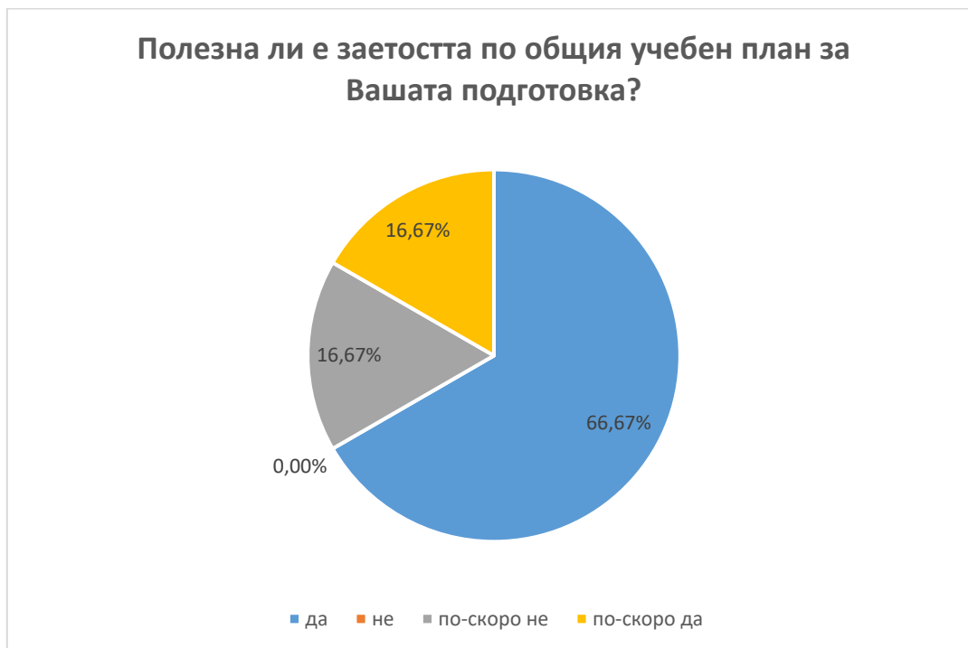
Фиг. 6 Полезност от заетостта по учебен план

В.8.1 50% от анкетираниите са напълно удовлетворени от подкрепата на научния си ръководител при определяне на темата и разработването на индивидуалния учебен план. Двама от анкетираниите докторанти дават отговор, че са по-скоро удовлетворени, а един по-скоро неудовлетворен от подкрепата (фиг. 7).