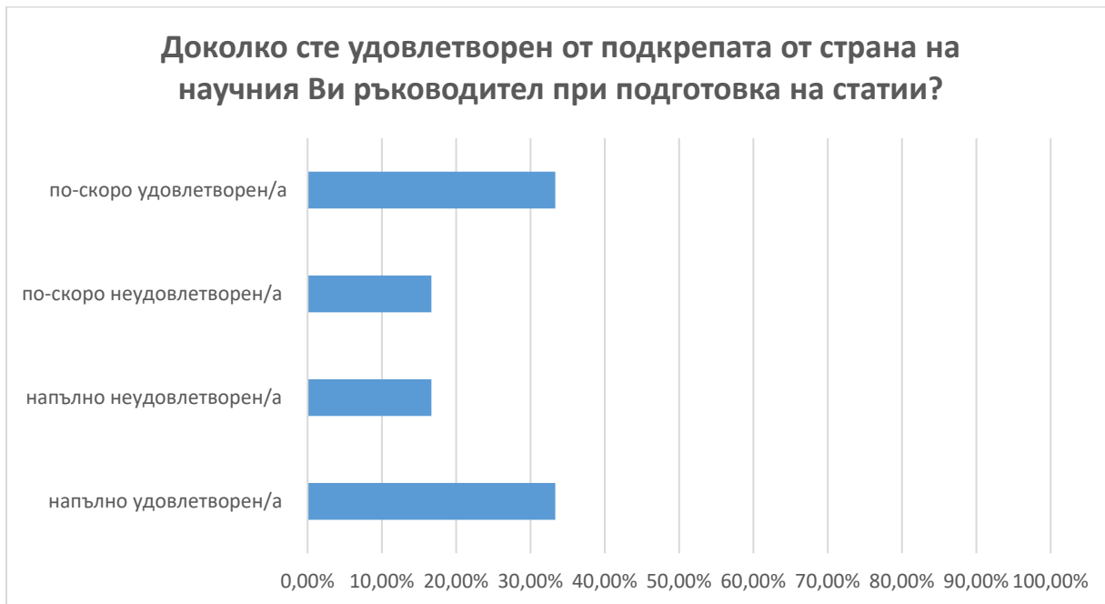
Фиг. 10. Удовлетвореност от подкрепа на научен ръководител при подготовка на статии

В.9 66.67% от анкетиранияте докторанти са на мнение, че катедрата в която се обучават предоставя необходимите условия за работа, 16.67 % посочват отговор „по-скоро да” и 16.67% „не“. (фиг. 11)