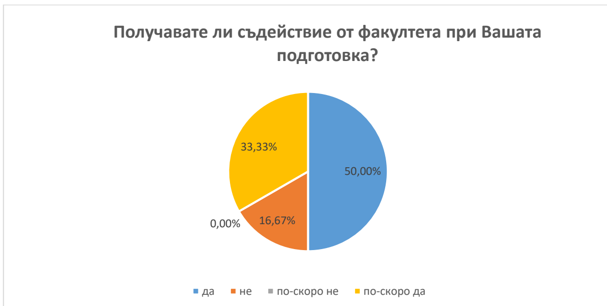
Фиг. 12 Съдействие от ФИСН при подготовка на докторантите

В.11 Болшинството от анкетираните са на мнение, че се осигуряват възможности за участие в научни форуми с публикуване на научни статии (83.33 % отговарят с „да“). С отговор ”по-скоро не” отговарят 16.67 % от анкетираните. (фиг.13)