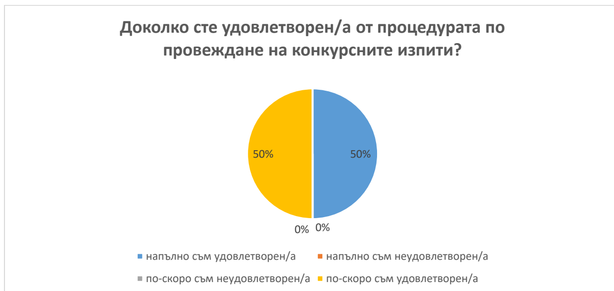
Фиг. 3 Удовлетвореност от процедурата по провеждане на конкурсни изпити

В.4 На въпроса: „Доколко сте удовлетворен/а от процедурата по провеждане на конкурсните изпити”, половината от анкетираните докторанти заявяват, че са напълно и половината, че са по-скоро удовлетворени от нея. (фиг. 3)