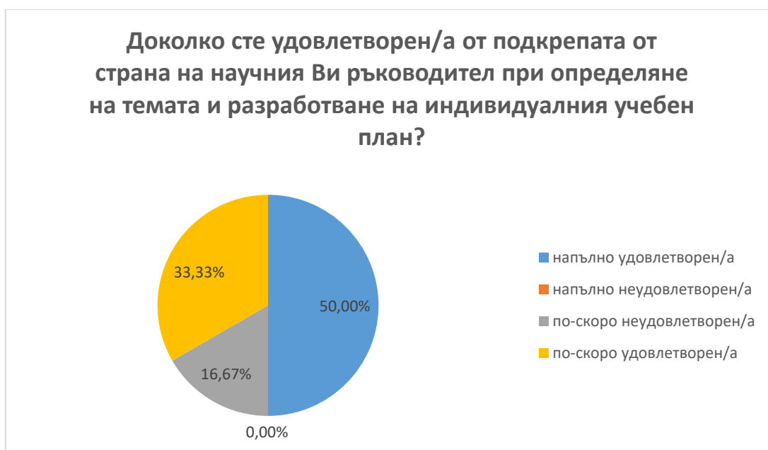
Фиг. 7. Удовлетвореност от подкрепа на научен ръководител при определяне на темата и разработване на индивидуален учебен план

В.8.1 50% от анкетираниите са напълно удовлетворени от подкрепата на научния си ръководител при определяне на темата и разработването на индивидуалния учебен план. Двама от анкетираниите докторанти дават отговор, че са по-скоро удовлетворени, а един по-скоро неудовлетворен от подкрепата (фиг. 7).