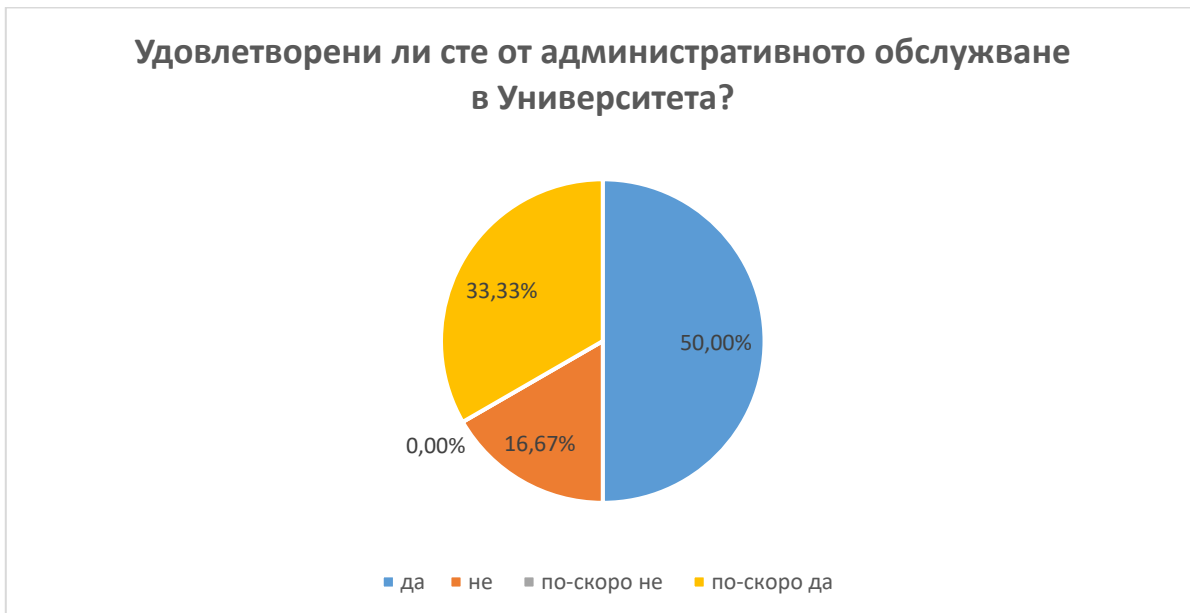
Фиг. 14 Удовлетвореност от административното обслужване в ПУ

В13. 66,67 % от анкетираните докторанти са на мнение, че обучението по докторската програма напълно подпомага, 33.33 % отчасти подпомага професионалната им реализация. (фиг. 15)