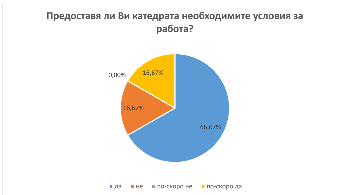
Фиг. 11 Предоставяне на необходими условия за работа от катедрата

В.9 66.67% от анкетиранияте докторанти са на мнение, че катедрата в която се обучават предоставя необходимите условия за работа, 16.67 % посочват отговор „по-скоро да” и 16.67% „не“. (фиг. 11)