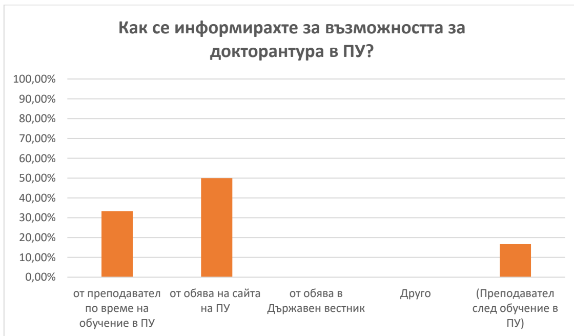
Фиг. 2 Начин на информиране за възможността за докторантура в ПУ

В.4 На въпроса: „Доколко сте удовлетворен/а от процедурата по провеждане на конкурсните изпити”, половината от анкетираните докторанти заявяват, че са напълно и половината, че са по-скоро удовлетворени от нея. (фиг. 3)