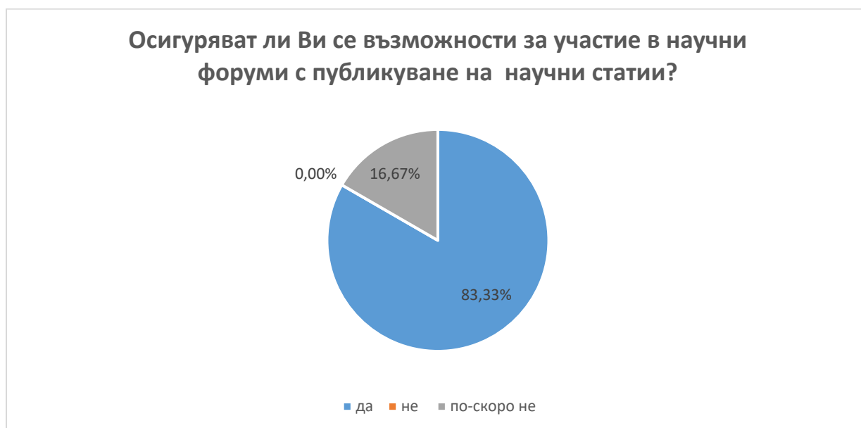
Фиг. 13. Възможности за участие в научни форуми с публикуване на научни статии

В.11 Болшинството от анкетираните са на мнение, че се осигуряват възможности за участие в научни форуми с публикуване на научни статии (83.33 % отговарят с „да“). С отговор ”по-скоро не” отговарят 16.67 % от анкетираните. (фиг.13)